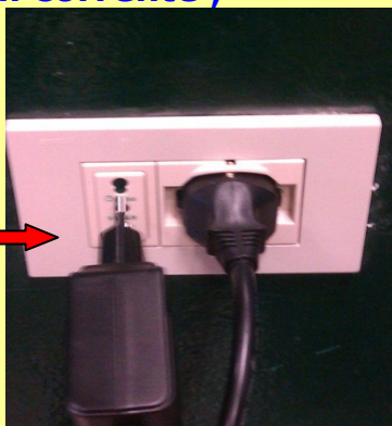
Collegamento cavi di alimentazione pc e L.I.M. alle prese