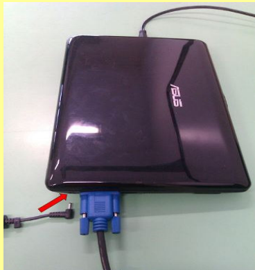
Cavo alimentazione pc